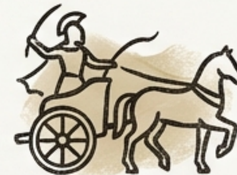
Carros de Guerra